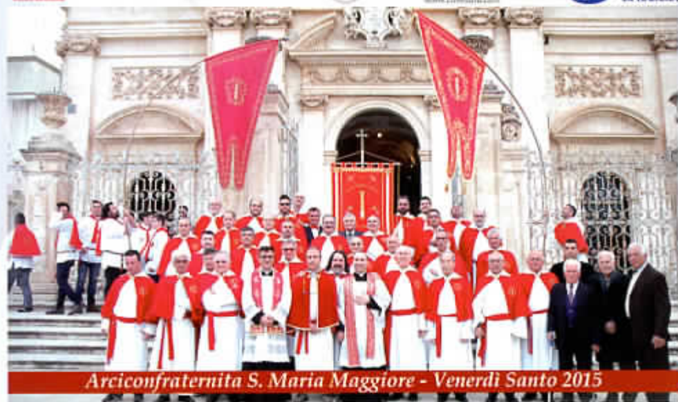
Arciconfraternita S. Maria Maggiore - Venerdì Santo 2015

GENROSSO International performing arts group