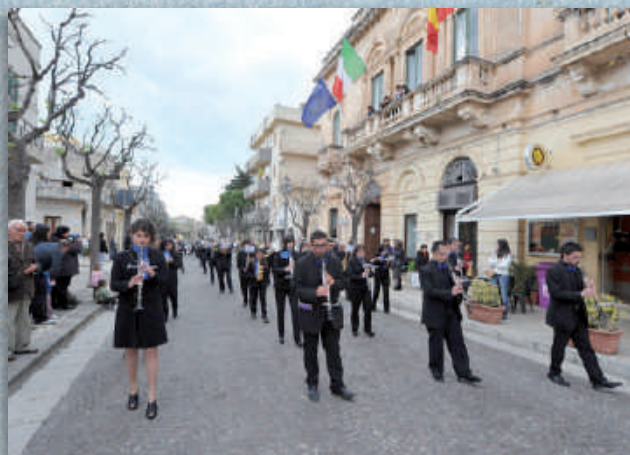
Associazione Musicale "Luigi Pescetti" Città di Mineo