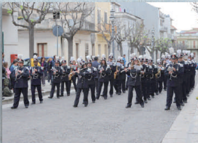
Complesso Bandistico "Vincenzo Bellini" Città di Grotte