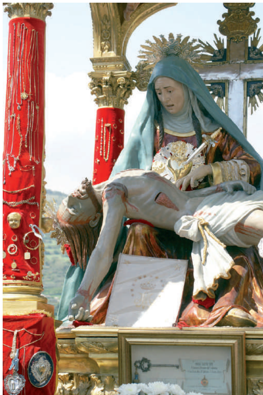
Maria SS. Addolorata di Monterosso Almo. Domenica in Albis.