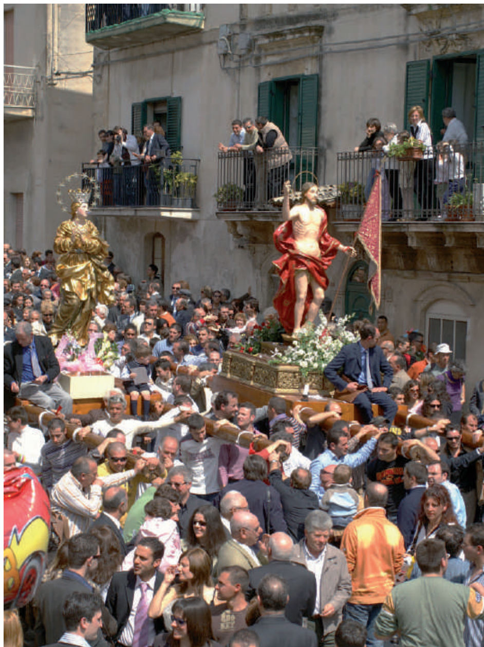
Pasqua a Ferla.