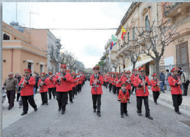
Corpo Bandistico "Città di Ispica"