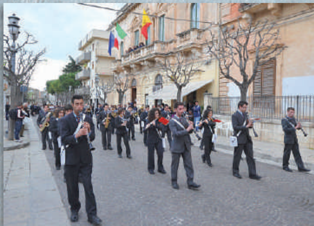
Associazione Musicale "Don Bosco" Città di Riesi