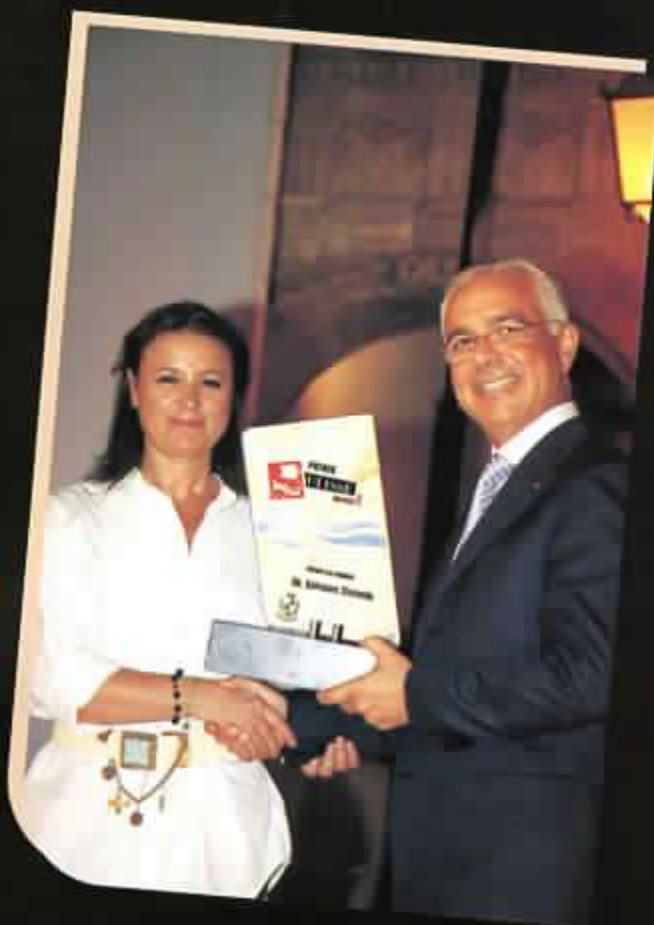
On. Salvatore Stornello già Sindaco di Ispica Deputato Regionale e Nazionale