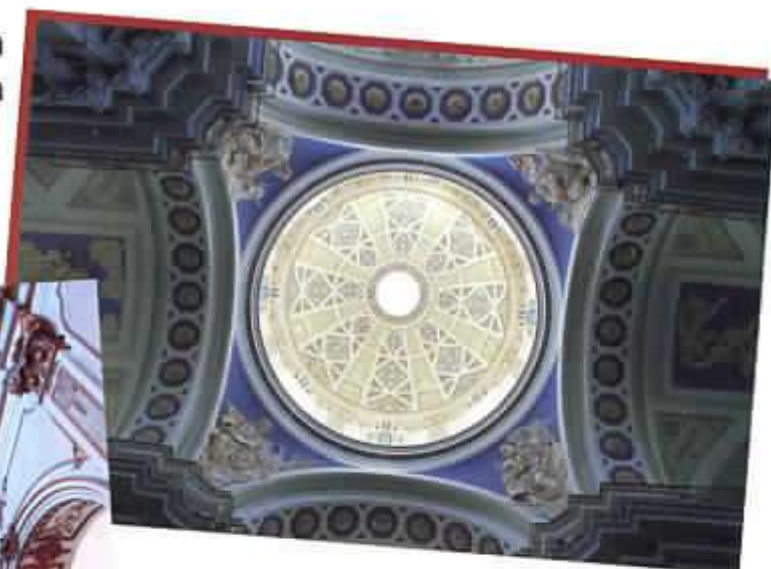
Cupola Basilica SS. Annunziata