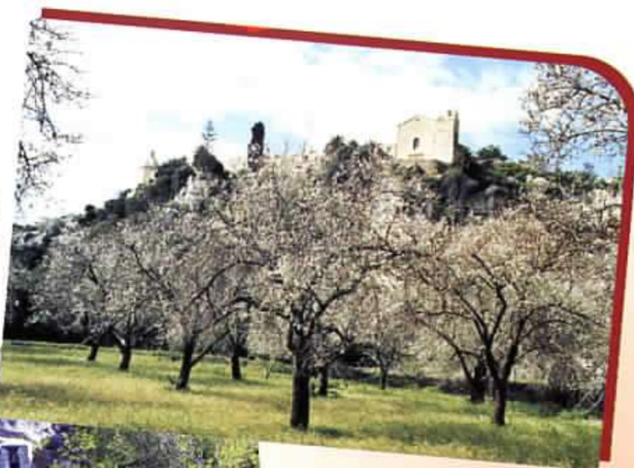
Veduta del Convento di Santa Maria di Gesù