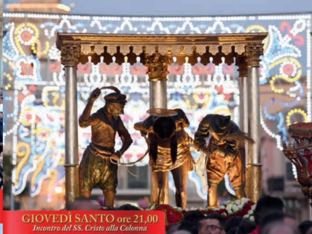
GIOVEDÌ SANTO ore 21,00 Incontro del SS. Cristo alla Colonna con l'Addolorata della SS. Annunziata