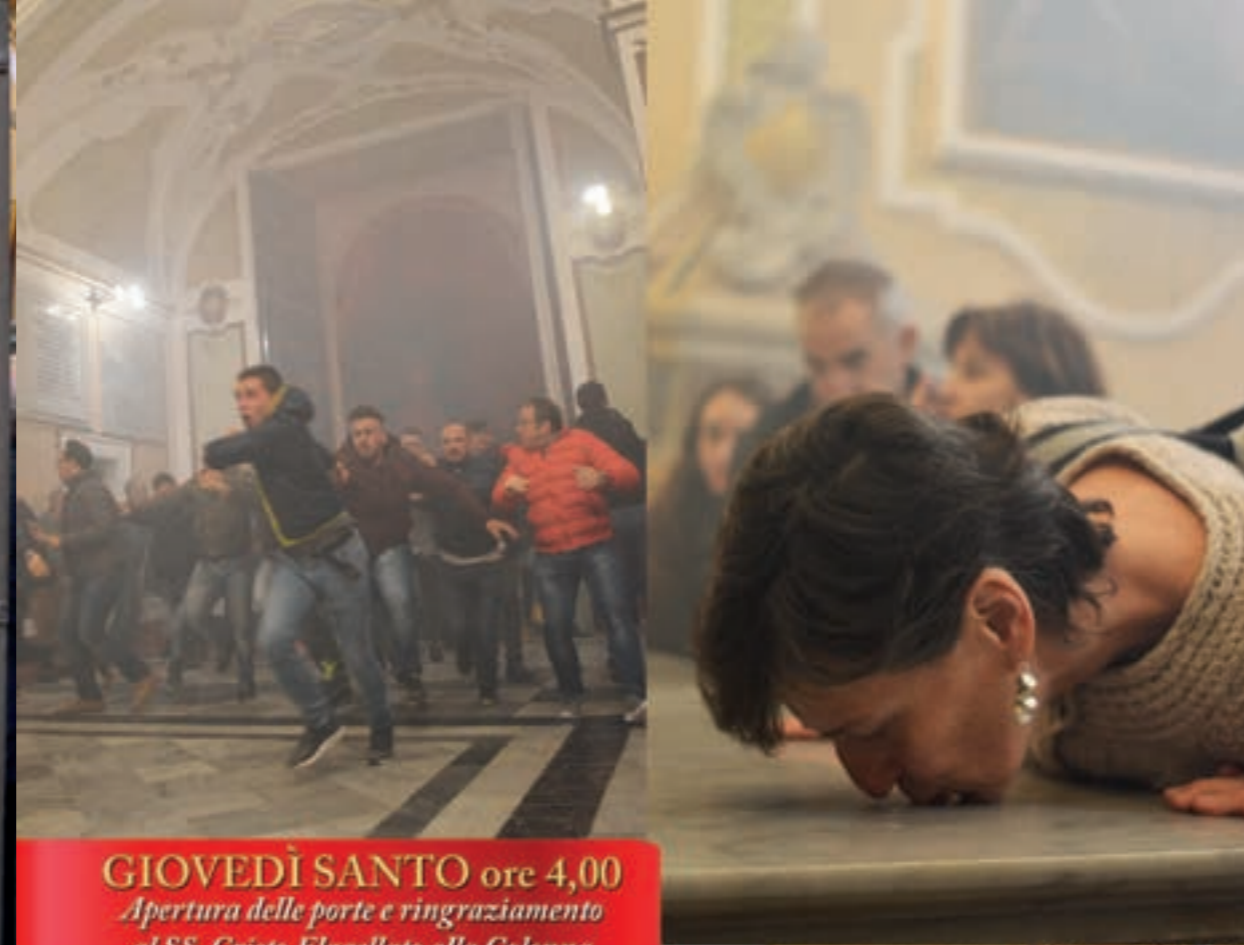
GIOVEDÌ SANTO ore 4,00 Apertura delle porte e ringraziamento al SS. Cristo Flagellato alla Colonna

ore 8.00 Giro per le vie cittadine del Corpo Bandistico "Città di Ispica".