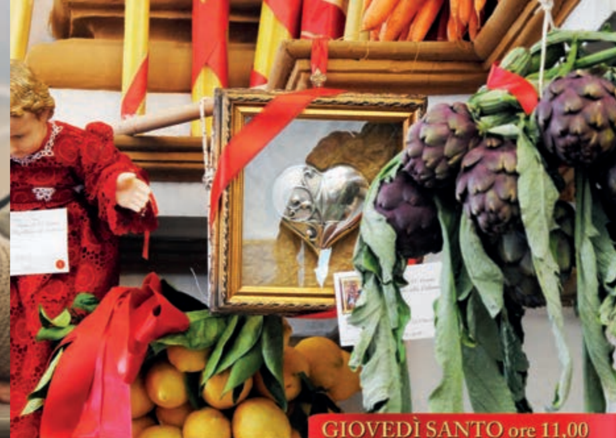
GIOVEDÌ SANTO ore 11,00 Ingresso della "Vara" - Svelamento della Sacra Immagine e "Scinnuta"