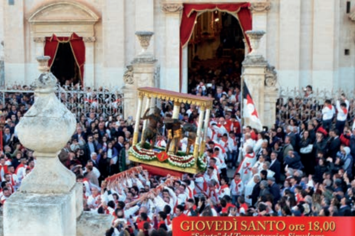
GIOVEDÌ SANTO ore 18,00 "Sciuta" del Tammaturgico Simulacro del SS. Cristo Flagellato alla Colonna