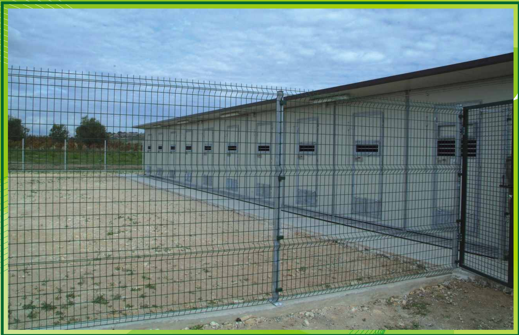
costruzione di un canile municipale